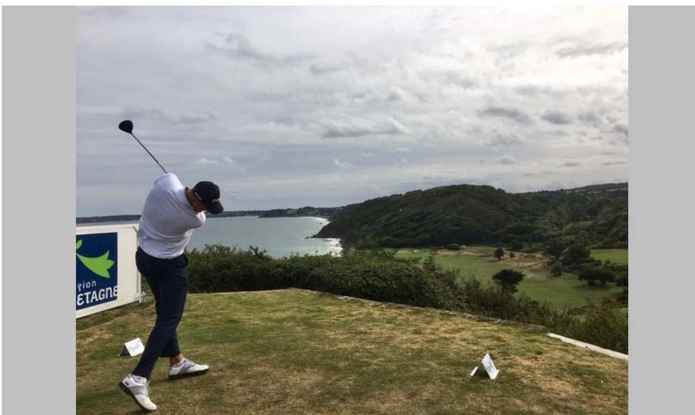
Trophée Philippe Chatrier Le spectaculaire départ du trou 11 du golf de Pléneuf Val-André

Disputé en équipe de deux joueurs selon la formule " scramble " ou " greensome " au choix du golf partenaire, le Trophée Philippe Chatrier connaît un succès d'estime grandissant chaque année. Si son slogan reste toujours: " Ensemble, luttons contre la maladie d'Alzheimer! ", la compétition évolue tous les ans en innovant sans cesse.